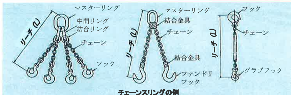
チェーンスリングの例