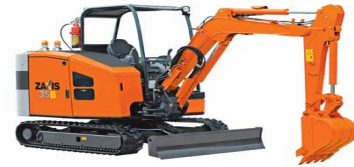
ZX35B リチウムイオンバッテリーミニショベル